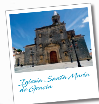
Iglesia Santa María de Gracia