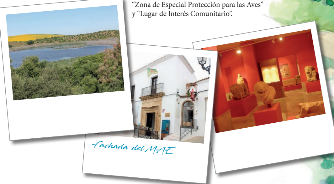
Fachada del MAE

Está compuesto por un conjunto de tres lagunas denominadas Dulce de Zorrilla, Salada de Zorrilla y Hondilla que se alimentan de las precipitaciones y aportes subterráneos de agua. Posee un valor faunístico indudable por ser el lugar ideal para la reproducción de la focha cornuda y la malvasía, especies actualmente amenazadas. Debido a su importancia está declarada "Zona de Especial Protección para las Aves" y "Lugar de Interés Comunitario".